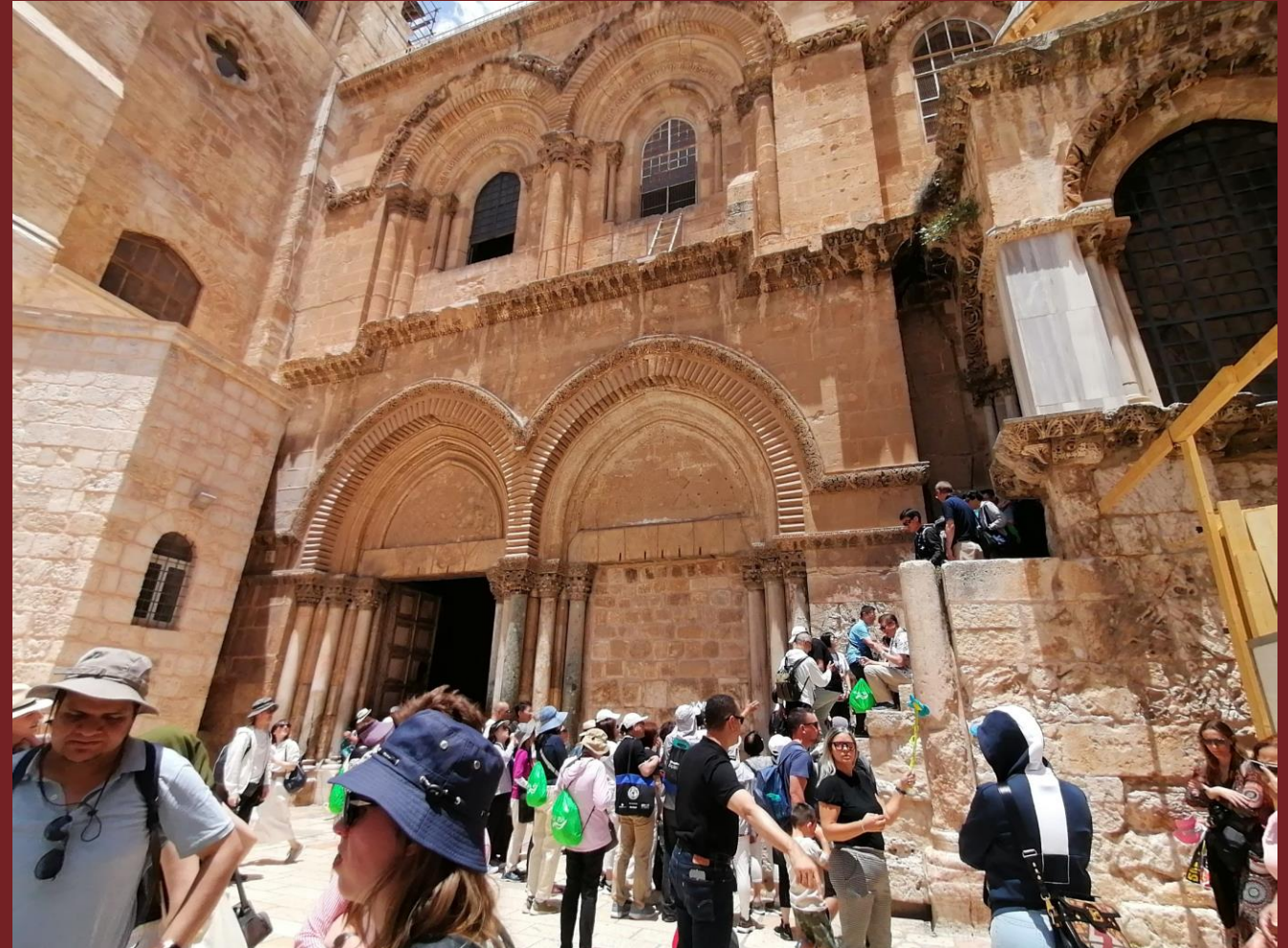
Der Eingang zur Grabeskirche