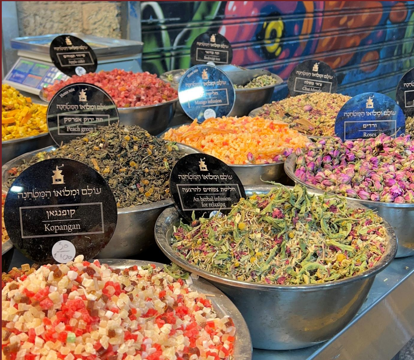
Zur Erholung ein duftender Kräutertee....