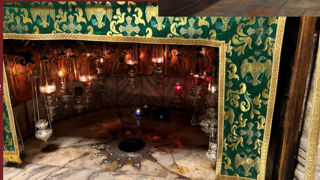
Die Geburtskirche in Betlehem