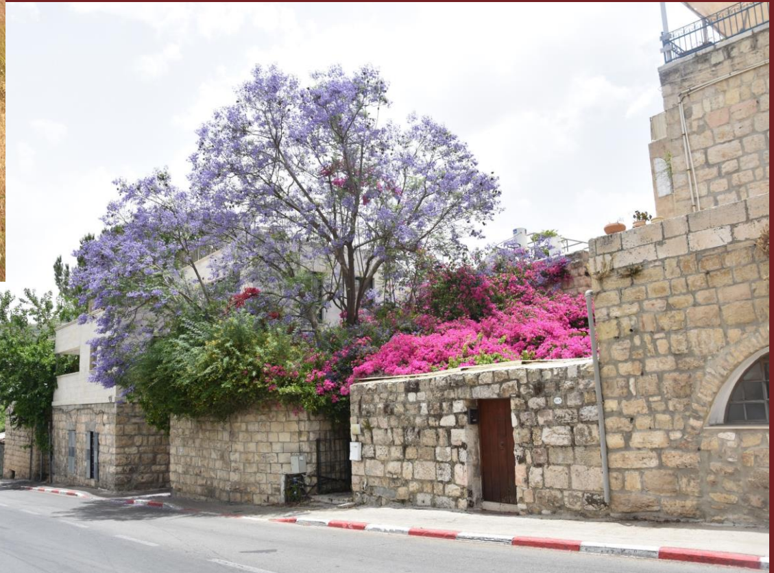
Wanderung nach Ein Kerem